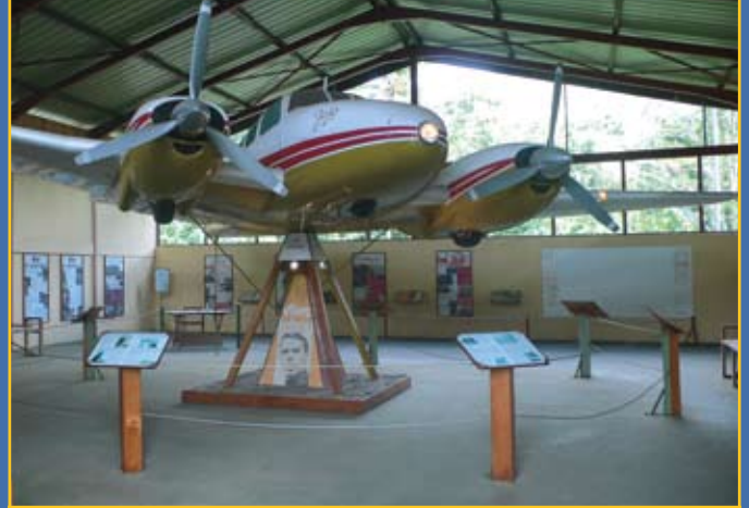
Jojo, l'avion de Jacques Brel à Atuona, Hiva Oa, Marquises

La baie de Nuku-Hiva, dans laquelle nous sommes mouillés, est une étendue d'eau en forme approximative de fer à cheval. Sa circonférence peut-être de neuf milles. On y accède de la mer par une passe étroite, flanquée de chaque côté par deux petits îlots jumeaux qui élèvent leur cône à la hauteur d'environ cinq cents pieds. À partir de là, le rivage s'éloigne de droite et de gauche et décrit un vaste demi-cercle. Depuis le bord de l'eau, la terre s'élève uniformément de tous côtés, par de vertes pentes, si bien qu'aux versants doucement ondulés et d'altitude médiocre, succèdent pour finir des mornes orgueilleux et grandioses, dont les silhouettes bleues bouchent la vue tout à la ronde. Rehaussant la beauté de ces rives, des ravins profonds et romantiques, dont les extrémités supérieures se perdent parmi l'ombre des sommets