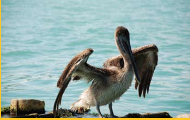
Aux Galapagos, l'accord est parfait entre les espèces