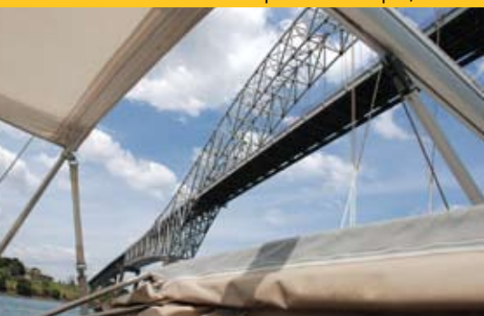
La Malu II sous le pont des Amériques, Panama

à m'entraîner de bar en bar dans cette ville glauque où quelques immeubles sinistres témoignent mal d'un passé prestigieux. Au vieux Yacht Club, deux jeunes femmes perchées sur des tabourets