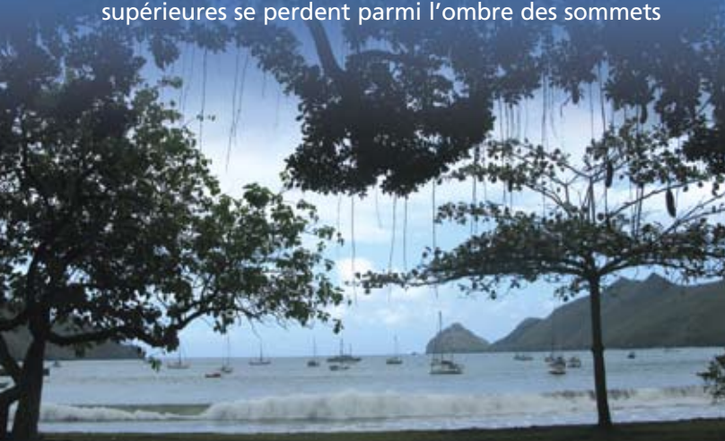
La Baie de Taiohae, Nuku Hiva, aux Marquises

Nous volons vers Nuku Hiva à bord d'un petit bimoteur qui se faufile entre les vallées avant de nous