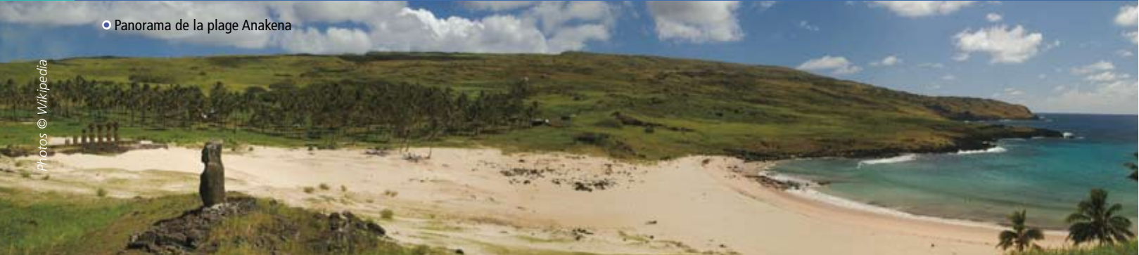
○ Panorama de la plage Anakena