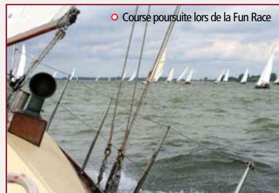
• Course poursuite lors de la Fun Race

la plupart y travaillent eux-mêmes, passant des hivers sans fin à restaurer, remplacer, poncer et vernir dans les courants d'air gelés de bâches mal ajustées. Ce qui fait le charme de ces bateaux n'est pas tant leur élégance, ou même leur importance historique ; mais plutôt leur âme palpable et la relation déraisonnable que leurs propriétaires entretiennent avec eux.