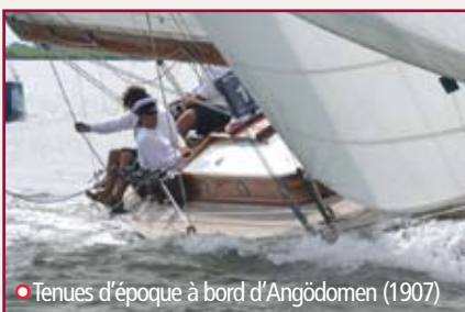
• Tenues d'époque à bord d'Angödomen (1907)