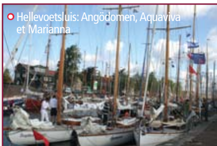
• Hellevoetsluis: Angödomen, Aquaviva et Marianna