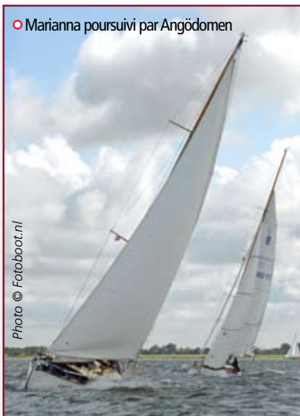
• Marianna poursuivi par Angödomen

À couple par quatre ou cinq, les 200 et quelques bateaux offrent un spectacle saisissant dans le port de Hellevoetsluis. Formes effilées, vernis des espars, grand pavois pour tout le monde, les manœuvres incessantes pour rejoindre la ligne de départ deux fois par