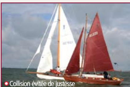
• Collision évitée de justesse

place en temps réel, et nous terminons 2 e de notre classe.