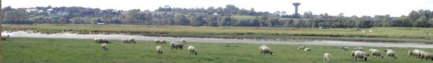
Vue vers le Nord, la grande boucle de la Sienne héberge quantité de moutons sur ses prés-salés.

Regnéville était alors le troisième port de pêche (morue) et de commerce du département. Plus tard, avec la multiplication du nombre de grands voiliers de commerce, on vit apparaître diverses structures maritimes et surtout une école de navigation qui produisit un nombre incroyable de capitaines au long cours. On dit qu'il n'est pas une maison à Regnéville qui n'ait vu naître un marin, c'est dire !