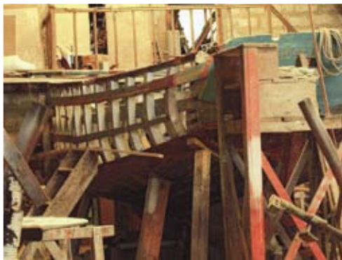
Deux étapes de la restauration du « Laisse-les-dire »