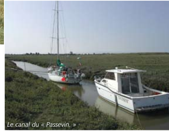
Le canal du « Passevin. »

Un ancien canal (« ruet ») permettait autrefois de rejoindre des parcs à huîtres, aujourd'hui disparus. L'appellation tire sans doute son origine du commerce du vin dont question plus haut. Toujours est-il que ce canal existe toujours. Très étroit, il sinue longuement dans les prés-salés. Régulièrement dragué,