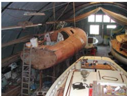
À gauche, l'étrange « Grand Gamin »

qu'au début des années 60, le chantier s'enrichit d'un second hangar. Le « Chantier de l'Anglais » se lance alors dans la construction de voiliers plus importants : le « Scorpène », 10 mètres, et le splendide « Koala », un course-croisière de 9 mètres. La renommée du chantier de Regnéville s'étend, grâce à la qualité du travail et aux techniques utilisées tel le « bordé norvégien » réalisé en