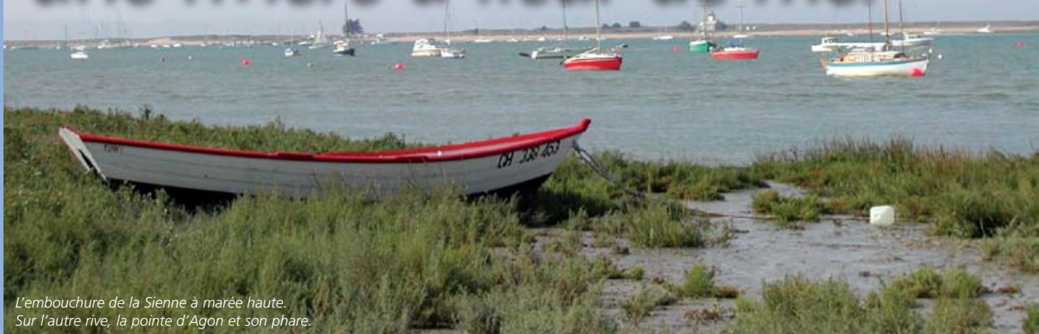
L'embouchure de la Sienne à marée haute. Sur l'autre rive, la pointe d'Agon et son phare.

Comme une Semois devenue soudainement Normande par la magie de quelques elfes voyageurs et facétieux, la rivière agite ses rubans sur près de 180 kilomètres. Née dans le Calvados, torrentueuse d'abord, paresseuse ensuite, la Sienne serpente délicieusement vers les côtes du Cotentin saluant Orval au passage – mais oui ! – avant que de se livrer enfin, sur fond de prés-salés, aux vagues amoureuses du continent marin. De ces noces éternelles, gardé par le cap d'Agon, est né un havre à nul autre pareil, berceau d'une lignée innombrable de cap-horniers et autres marins au long cours. Situé à quelques encablures des îles Chausey, à douze milles au nord de Granville, Regnéville s/Mer est assurément une escale où poser son sac de marin. N'espérez pas y trouver de bassin à flot, encore moins une marina ! C'est un mouillage forain difficile d'accès et interdit à tout qui ne sait béquiller.