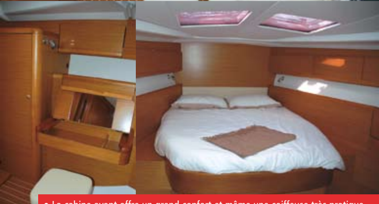
• La cabine avant offre un grand confort et même une coiffeuse très pratique