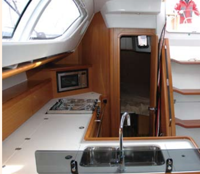
• Cuisiner en mer en se calant confortablement si le voilier gîte

vous permettra de cuisiner en mer, car il est possible de se caler à la gîte quelle que soit l'allure du voilier. Logiquement, le carré se trouve sur tribord en prolongement de l'espace cuisine. C'est un carré en « U », classique et convivial. Dans la version essayée, la cabine propriétaire se trouve à l'avant, avec un lit central de 200 x 160 cm, des marches des deux côtés du lit pour en faciliter l'accès. On y trouve de nombreux rangements ainsi qu'une coiffeuse pouvant aussi servir de petit bureau. À l'arrière, les deux cabines classiques sont de bonnes dimensions et comportent un espace et des rangements largement suffisants pour deux personnes. En général, l'aération est bien assurée par de nombreux hublots, sauf peut-être au niveau de la cuisine où un hublot d'aération au dessus de la cuisinière serait le bienvenu. L'éclairage direct et indirect est remarquable ; en effet, nous avons compté 14 points d'éclairage dans le carré et 10 dans la cabine avant.