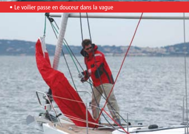
• Le spi sort de sa cale technique avec facilité