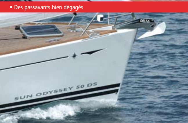
• Des passavants bien dégagés