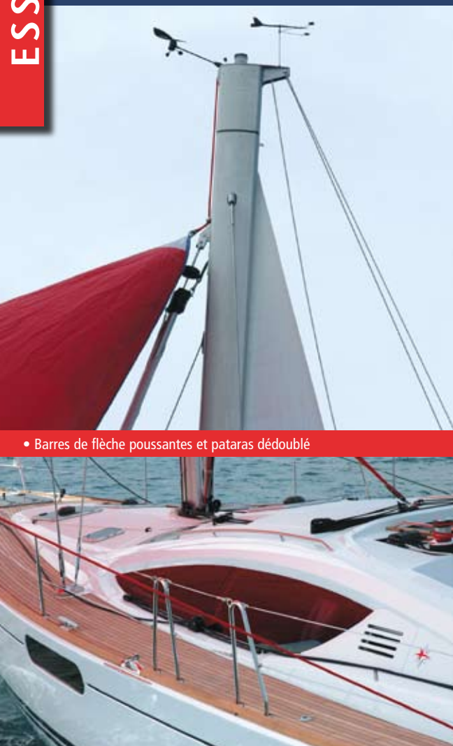
• Barres de flèche poussantes et pataras dédoublé