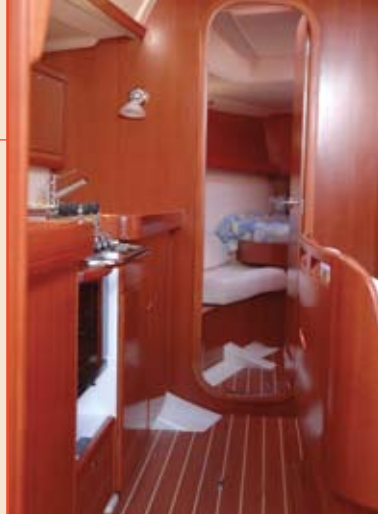
Le coursive d'accès à la cabine avant.