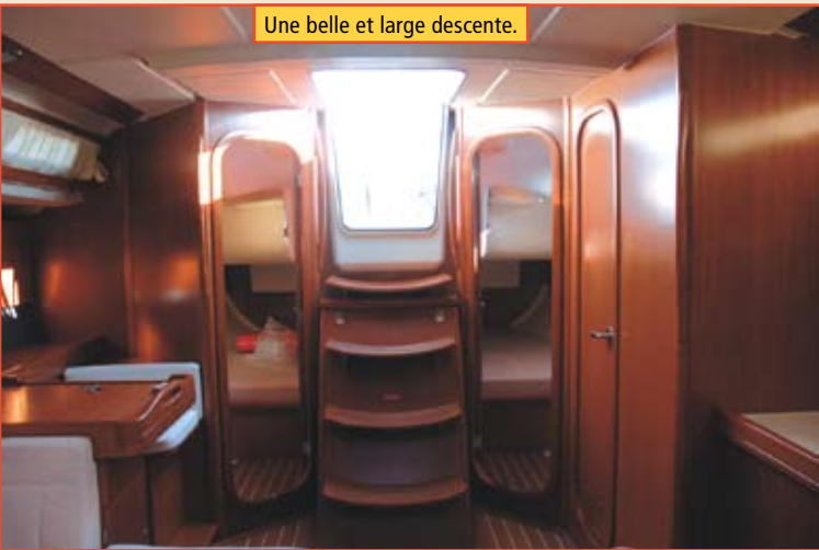
Une belle et large descente.

En empruntant la belle et large descente, on trouve à tribord une belle table à cartes au format demi-aigle dans le sens de la marche, pourvue d'innombrables rangements et d'un siège incurvé. À bâbord, une salle d'eau, très design, à disposition des deux cabines arrière. La cuisine est tout en longueur et forme, avec le carré, un espace de vie particulièrement harmonieux et agréable. Pour cuisiner à la gîte, le cuistot dispose, dans son dos, d'une banquette centrale montée sur vérin et qui donne accès à un gros volume de rangement, très pratique. Pas d'ouverture frontale pour le frigo d'une capacité de 130 litres, bien compartimenté et doté de bacs coulissants qui facilitent la vie à bord. L'aération est assurée par des hublots ouvrants, juste au dessus de la cuisinière. Les mains courantes sont omniprésentes , vous en retrouvez à tous les endroits délicats, où la