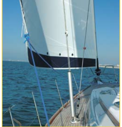
Un génois à recouvrement modéré, facile à border.

Une étrave droite et des entrées d'eau tout en finesse.