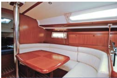
Un carré spacieux pour accueillir les amis...