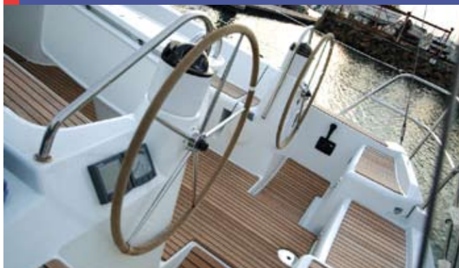
Un double poste de barre facilite la circulation.