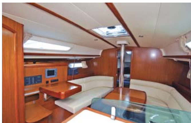
Du bois blond façon teck, coussins blancs pour un espace agréable.

A l'intérieur on retrouve toute la tradition du chantier Jeanneau : une ambiance classique mais soignée, comme par exemple, les châssis de portes arrondis; l'utilisation d'une essence de bois plus claire que d'habitude, un bois blond imitant le teck; les vaigrages et les coussins blancs apportant une belle clarté et donnant un sentiment d'espace agréable.