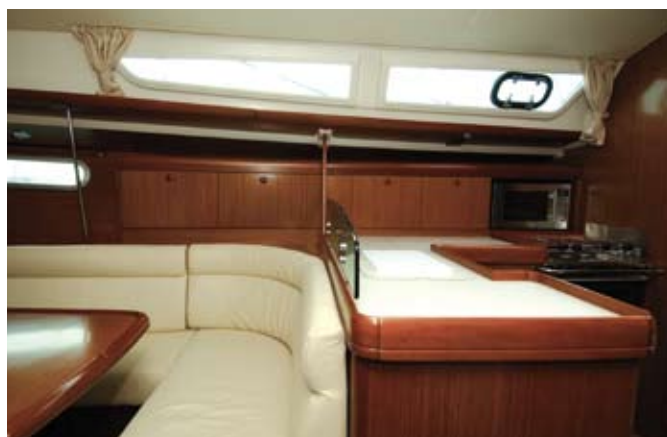
Une cuisine en «L» imposante.