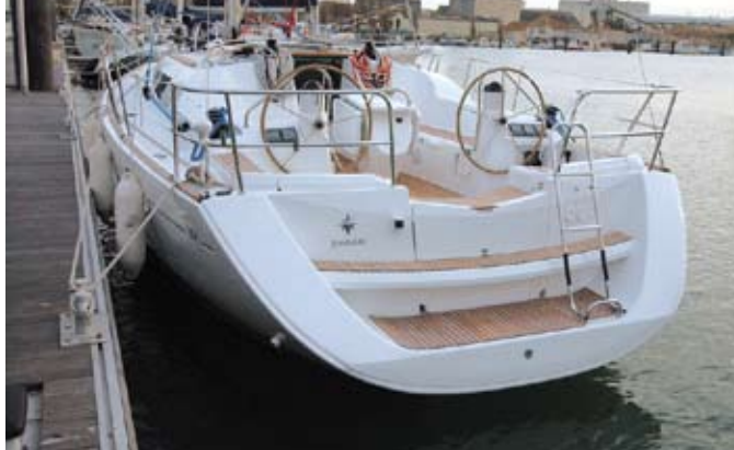
Une belle jupe arrière ... idéale pour la baignade.