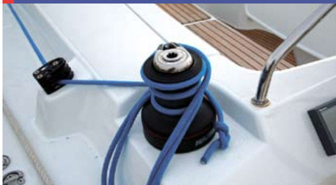
Des winches de génois placés très en arrière.

ches de génois sont placés très en arrière, ce qui permet d'assurer une navigation en équipage réduit. En effet, même derrière la barre, le barreur peut accéder très facilement aux réglages des winches. Au centre du cockpit, se dresse une belle table en polyester avec rabats. Tous les autres réglages se concentrent autour des deux winches de rouf disposés de manière à ne pas être gêné par la capote lorsqu'on borde à la manivelle.