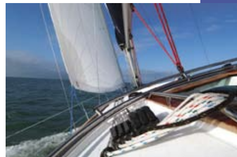
Un « ratelier » très efficace.

C'est donc au près, toutes voiles établies que nous décidons de faire marcher ce nouveau 39 I. Dans une mer de moins en moins facile à négocier, le bateau s'en sort toujours très bien. Le contrôle de barre se fait soit avec la barre à roue sous le vent, soit avec celle au vent. Il reste doux et neutre. La profonde pelle de safran maintient le cap en toutes situations ce qui évite les éventuels départs au lofs intempestifs. Le bateau reste facile à barrer et sa raideur à la toile est surprenante grâce à une quille profonde de deux mètres. Au près, la table de cockpit joue un rôle idéal, pour le calage des pieds des équipiers, bien nécessaire, car à cette allure le 39 I est un bateau quelque peu gâtard. Le speedo affiche une vitesse au près très correcte de 6 à 7 nœuds.