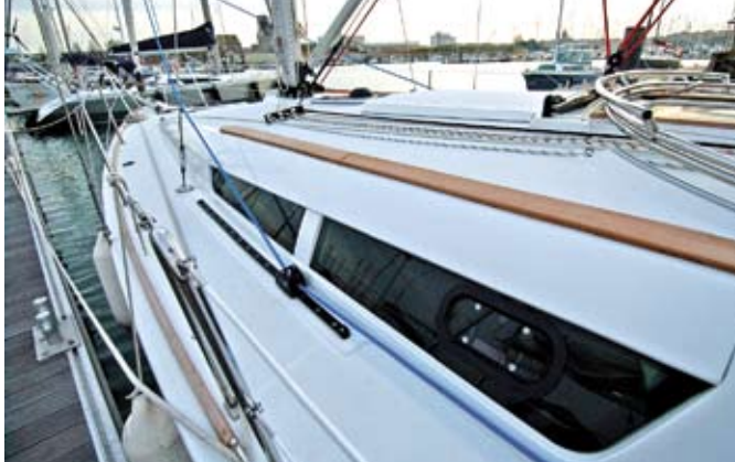
Le point de tire du génois facilite la circulation.

Afin d'éviter une voile d'avant trop grande, le chantier a opté pour un gréement atypique avec un petit génois à 120 % de recouvrement malgré les longues barres de flèche. Son point de tire se glisse judicieusement entre la cadène de hauban sur le bordé et celle de bas-hauban contre le rouf ; le câble ainsi rentré vers l'intérieur, libère par la même occasion la circulation vers l'avant. L'élégant plan de pont s'inspire des Sun Odyssey 45 et 49 avec des équipements de marque type Harken et Selden.