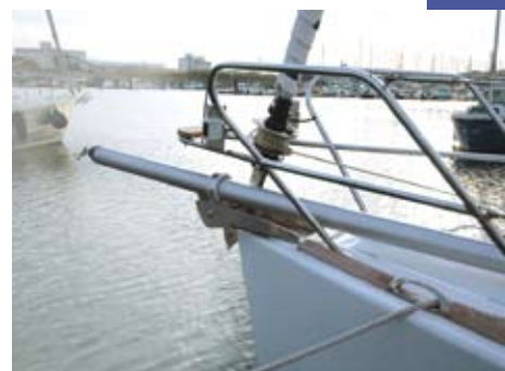
Un bout-dehors amovible.

Le 39 I est équipé d'un bout-dehors amovible permettant l'envoi d'un grand spi asymétrique de 97 mètres carrés. Une chaussette à spi, bien utile en croisière pour limiter les risques lors de son envoi et/ou de sa rentrée, complète l'équipement. Cet essai ne nous a malheureusement pas offert l'opportunité d'essayer pleinement le bateau sous cette allure, mais il semble évident que, là aussi, son comportement serait très sûr.