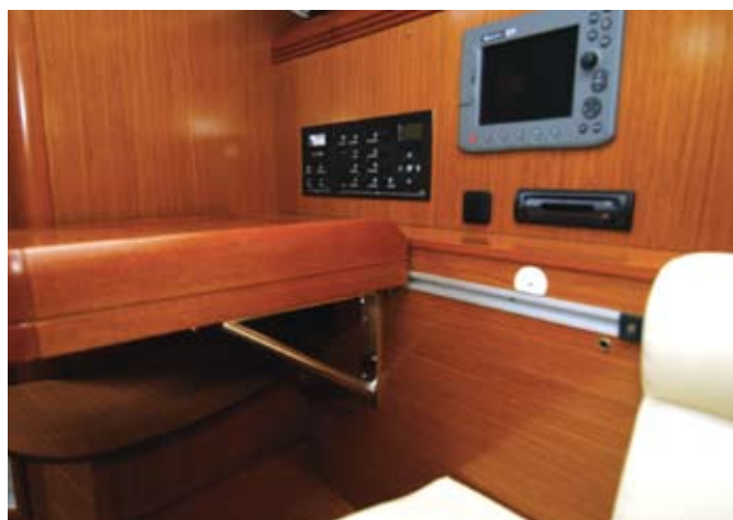
La table à cartes se glisse sur des rails et offre une double orientation.