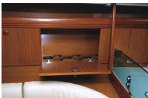
... et leur offrir les richesses du bar !